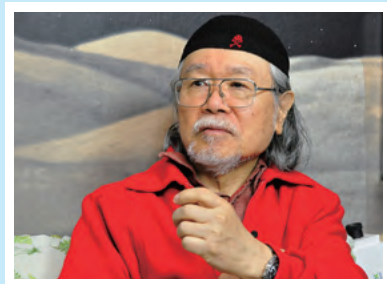
北九州市漫畫博物館