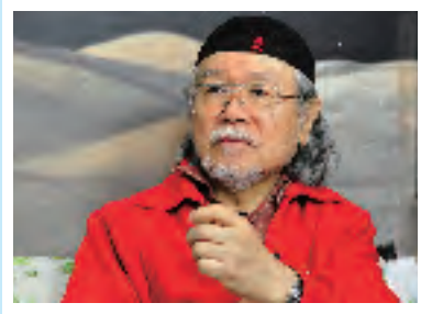
พิธีกรณที่หนังสือการ์ตูน คิตะคิซุ มังงะ มิวเซียม