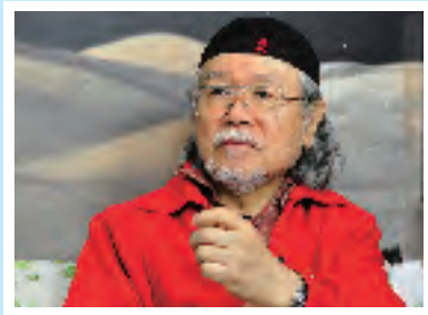
기타큐슈시 만화 박물관